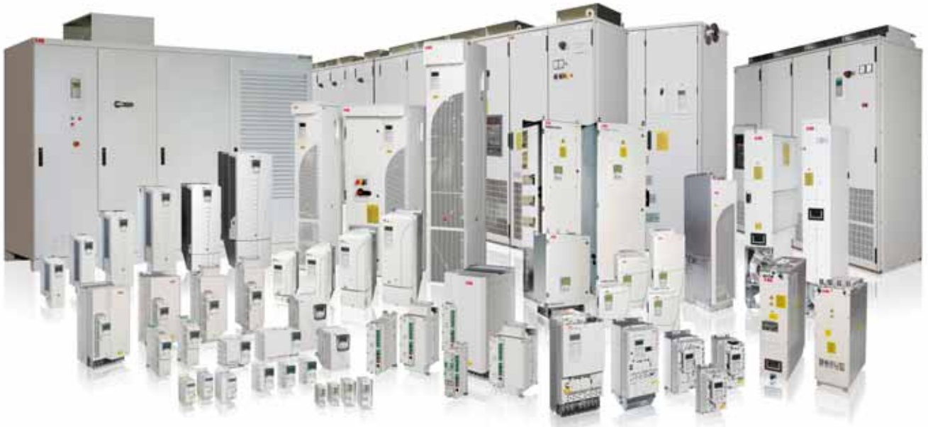
ABB Machinery Drive