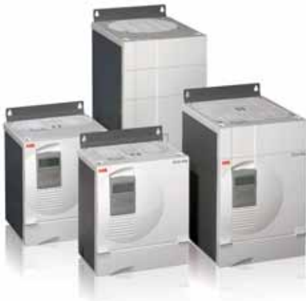
ABB DC-Stromrichter sind als rückspeisefähige Stromrichter lieferbar. ABB bietet Lösungen von digitalen DC-Stromrichtermodulen für typische OEM-Applikationen bis zu kompletten Antrieben in Schaltschränken. Die Stromrichter sind auch für die Modernisierung vorhandener Antriebe oder Erweiterungen bestens geeignet. Sie sind im Leistungsbereich von 9 kW bis 18 MW mit 12-Puls-Systemen lieferbar.