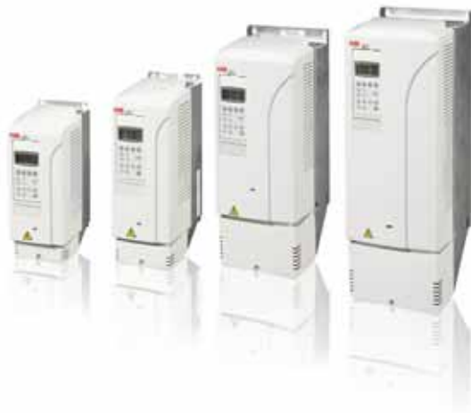
ABB Single Drive

ABB Industrial Drives sind hochflexible Frequenzumrichter, die kundenspezifisch angepasst werden können, um die Anforderungen industrieller Anwendungen genau zu erfüllen. Die Frequenzumrichter decken einen großen Leistungs- und Spannungsbereich ab, bis zur Spannung von 690 V. Industrial Drive-Frequenzumrichter sind in unterschiedlichsten Ausführungen verfügbar: für die Wandmontage, frei stehend, als Schrankgeräte, industrielle Montagesätze, als Multidrive-Einbaumodule und -Schrankgeräte mit Luft- oder Flüssigkeitskühlung.