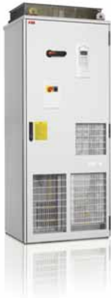
ABB Single Drive-Frequenzumrichter-Schrankgeräte werden werksseitig komplett montiert und als eine Einheit geliefert. Oft ist im Schrank auch weiteres Zubehör wie Schütze, Erdschluss-Überwachungsgeräte usw. integriert. Diese Komponenten sind, falls bestellt, bereits eingebaut, wenn das Frequenzumrichter-Schrankgerät geliefert wird. Die Fertigung erfolgt typischerweise auf Bestellung.