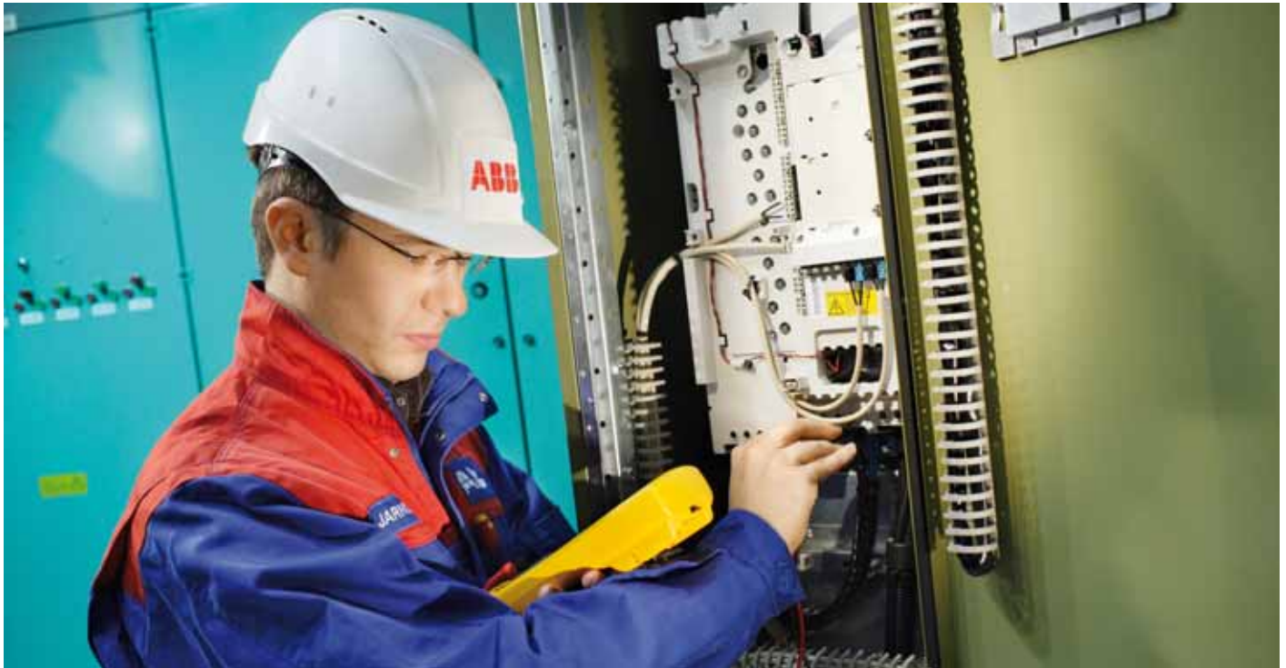
ABB verfügt über umfangreiche Erfahrung mit der Antriebstechnologie, die in einer Vielzahl unterschiedlicher Applikationen in den meisten Industriezweigen eingesetzt wird. Die Fachleute sprechen Ihre Sprache und zeigen den schnellsten Weg zu einer rentablen Lösung auf, ohne die Sicherheit von Personen und die Verantwortung für die Umwelt außer acht zu lassen.