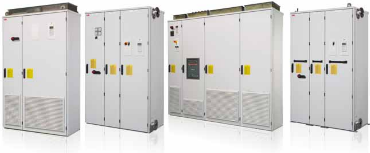
ABB Niederspannungsfrequenzumrichter ABB Industrial Drive