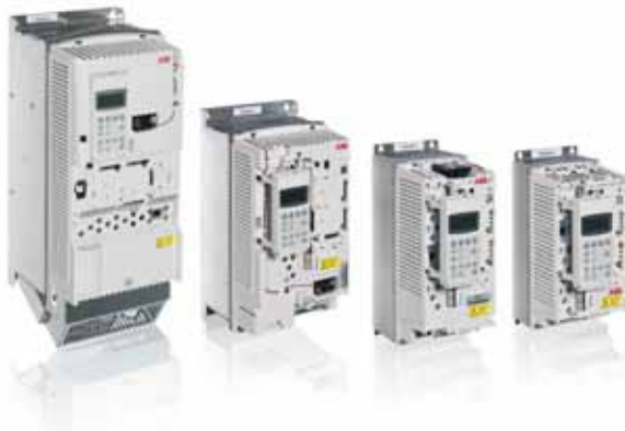
ABB Single Drive-Einbaumodule ermöglichen eine schnelle und kostengünstige Installation in Schaltschränke. OEMs, Systemintegratoren und Schaltschrankbauer können damit ihre eigenen Antriebslösungen unter Verwendung der Antriebs-technik von ABB realisieren und von den vielfältigen Vorteilen der ABB-Frequenzumrichter profitieren, wie z.B. der DTC-Motorregelung, der adaptiven Programmierung sowie von zahlreichen integrierten und externen Optionen. ABB liefert genaue Anweisungen für den Schrankeinbau und weitere Unterlagen, um die Kunden bei der Realisierung ihrer Lösungen zu unterstützen.