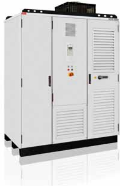
ABB hat ein komplettes Produktangebot für Antriebslösungen mit Transformatoren, Frequenzumrichtern und Motoren.

Die Frequenzumrichter sind mit Luft- oder Wasserkühlung und mit verschiedenen Netzanschlussoptionen für die Einspeisung lieferbar. In einige Produkte kann der Einspeisetransformator integriert werden oder sie sind direkt ohne Einspeisetransformator an das Stromnetz anschließbar und sparen dadurch Gewicht und Platz.