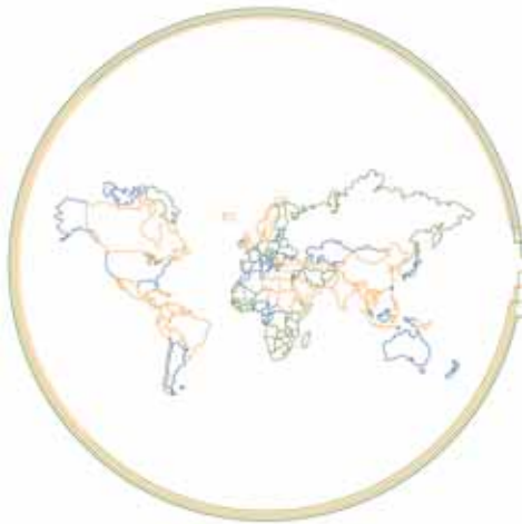
ABB hat ein globales Netz von Vertriebspartnern gebildet, mit dem Sie Produkte, Service und Support praktisch direkt vor Ihrer Haustür haben. Die Partner kennen die lokalen Märkte genau und sind mit den Niederspannungsantrieben und den Prozessen von ABB bestens vertraut. Die meisten von ihnen haben auch umfangreiche branchen- und applikations-spezifische Kenntnisse und Erfahrungen.

Zu diesen Vertriebspartnern gehören Lieferanten von Antriebstechnik, Systemintegratoren und auch der Elektro-Großhandel. Sie alle stehen Ihnen mit Erfahrung und Service zur Verfügung und können gemeinsam mit ABB Ihre Antriebsaufgaben lösen.