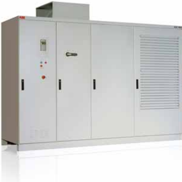
ABB Mittelspannungsfrequenzumrichter werden in vielen Industrieapplikationen, wie der Papier- und Zellstoffherstellung, Metallverarbeitung, Bergbau, Zementherstellung, Stromerzeugung, der chemischen Industrie, Öl- und Gasindustrie, Wasserversorgung und Abwasseraufbereitung sowie der Nahrungsmittel- und Getränkeherstellung eingesetzt.

ABB hat ein umfangreiches Portfolio an Frequenzumrichtern zur Drehzahlregelung und Soft-Startern für Mittelspannungsanwendungen im Leistungsbereich von 315 kW bis über 100 MW.