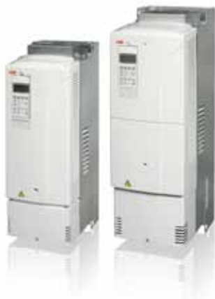
ABB Niederspannungsfrequenzumrichter ABB Industrial Drive