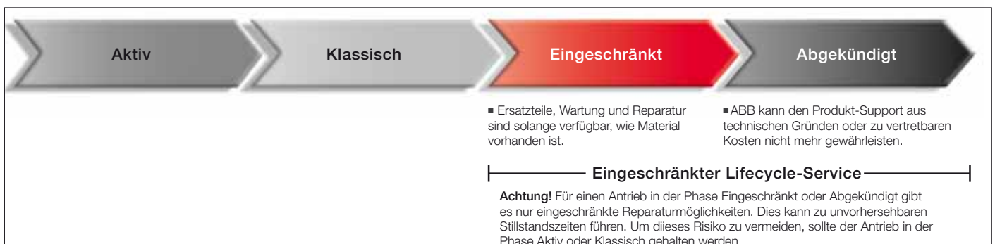
ABB folgt einem Vier-Phasen-Modell für das Lifecycle-Management der Antriebe, um seinen Kunden einen besseren Support zu bieten und die Effizienz zu steigern.

Der Lifecycle-Service umfasst: Auswahl und Dimensionierung, Installation und Inbetriebnahme, vorbeugende Wartung und Instandsetzung, Fernleistungen, Ersatzteillieferungen, Schulung und Weiterbildung, technischen Support, Umrüstung und Modernisierung, Austausch und Recycling.