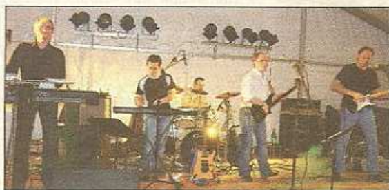
Für die nächtliche Unterhaltung ihrer Gäste hatte die Firma ESA die Gruppe „van voice“ engagiert.